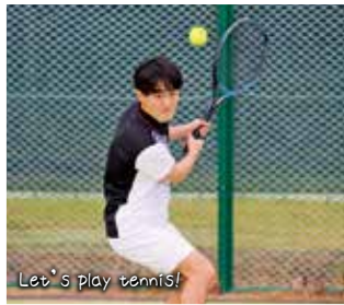
Let's play tennis!