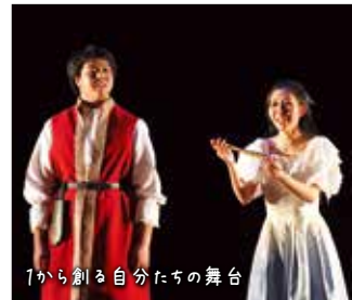
1から創る自分たちの舞台