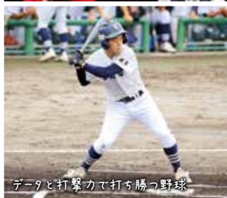
データと打撃力で打ち勝つ野球