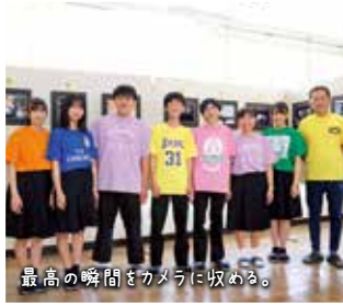
最高の瞬間をカメラに収める。