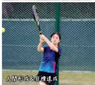
人間形成&目標達成