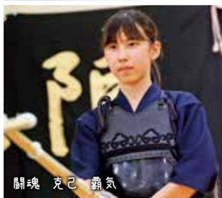
闘魂 克己 覇気