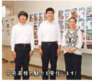
中央高校の魅力を発信します!