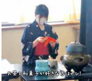
お茶と菓子が好きな方はぜひ!