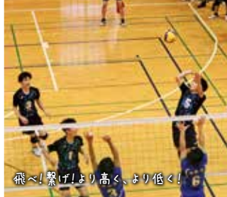
飛べ! 繋げ! より高く、より低く!