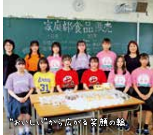
“おいしい”から広がる笑顔の輪