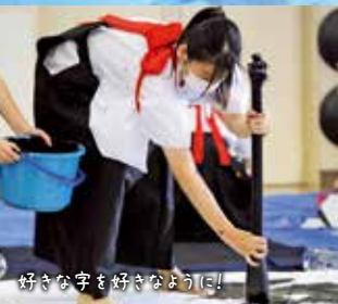
好きな字を好きなように!