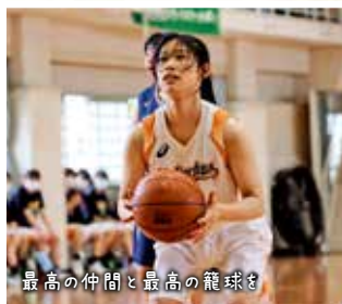
最高の仲間と最高の籠球を