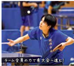
チーム全員の力で県大会へ進む!