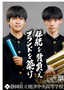
静岡県立焼津中央高等学校