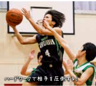
ハードワークで相手を圧倒する!