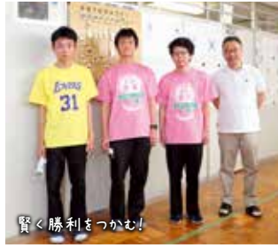
賢く勝利をつかむ!