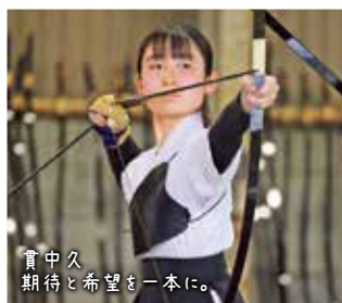
貫中久 期待と希望を一本に。