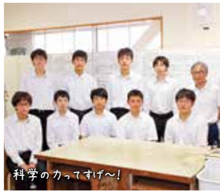
科学のカーブすげ〜!