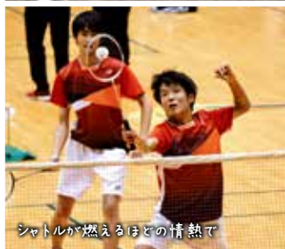
シャトルが燃えるほどの情熱で