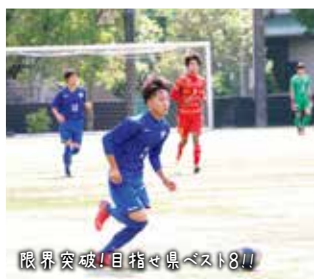
限界突破!目指せ県ベスト8!!