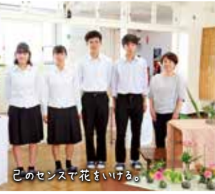
己のセンスで花をいける。